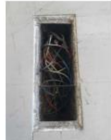
EXEMPLO DE CAIXA DE PASSAGEM A SER FECHADA COM AS TAMPAS