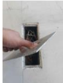
MODELO DE CHAPA METÁLICA ORIGINAL EXISTENTE