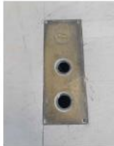
MODELO DE CHAPA METÁLICA ORIGINAL EXISTENTE